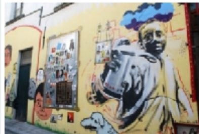
Мастацтва Муралес у Бруселі (Індустрыяльная частка)