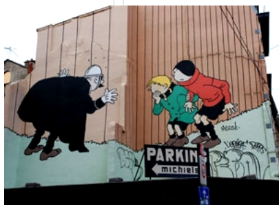
Мастацтва Муралес у Бруселі

Установа стварае таксама ўмовы для рэалізацыі ўласнага творчага праекту, выдзяляе сродкі на вандроўкі. Навучальны працэс уяўляе з сябе серыю майстар-класаў, для правядзення якіх запрашаюцца вядомыя еўрапейскія мастакі. Кантынгент навучэнцаў, як і выкладчыкаў, таксама міжнародны. Напрыклад, сёлета, сярод 25