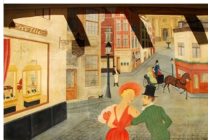
Мастацтва Муралес у Бруселі (Стары горад)

Факт з'яўлення палітычных графіці і таго, як пра гэта дбаюць нашы камунальныя службы – агульнавядомы. Адна з найбольш характэрных рысаў Мінску, не раз заўважаная культуролагамі – пустага і ўласцівага гэтай пустаце